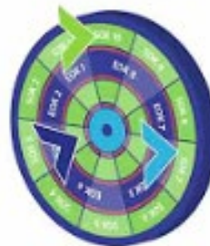
Slovensko ogrodje kvalifikacij (Bumerang)

Vsi videoposnetki so objavljeni na našem Youtube kanalu , kjer lahko najdete še druge promocijske in informativne videe na temo SOK in EOK.