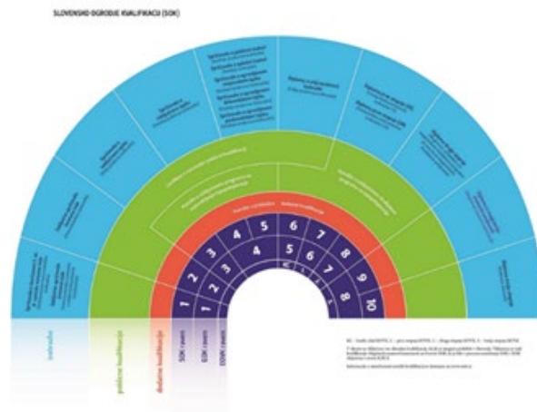
Slika 1: Slovensko ogrodje kvalifikacij

NKT SOK-EOK bo tudi v prihodnje nadaljeval dejavnosti na področju promocije SOK in EOK.