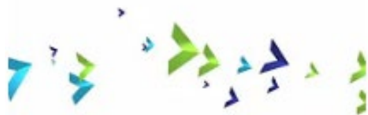
Slovensko ogrodje kvalifikacij (Ptice)

Prvi video prikazuje uporabnost zapisane ravni SOK in EOK na diplomah, spričevalih in drugih potrdilih. Udeleženci izmenjav ali osebe, ki iščejo zaposlitev v tujini, ali se odločajo za izobraževanje v tuji državi, se lahko preko SOK informirajo o doseženi ravni ter to informacijo posredujejo potencialnemu delodajalcu, šoli in lažje komunicirajo svojo doseženo raven in umeščanje v evropski prostor ob poznavanju EOK.